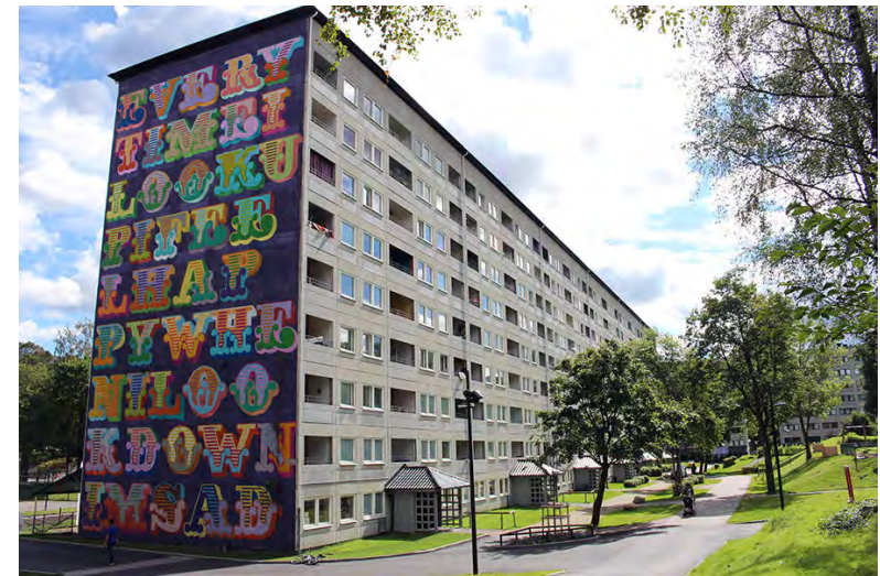
Kunstprojekt Urban Art 2017