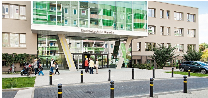
Tagungsort: oskar. DAS BEGEGNUNGSZENTRUM IN DER GARTENSTADT DREWITZ