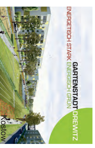
Konrad-Wolf-Allee nach der Sanierung Grüne Achse