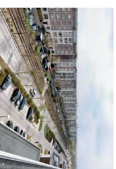
Konrad-Wolf-Allee vor der Sanierung