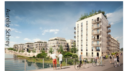
WATERKANT - BERLIN

In der Nachbarschaft entsteht die neue Siemensstadt 2.0. - Berliner Silicon Valley - als Beispiel für das Zusammenspiel von modernsten Forschungs- und Produktionsstätten mit zeitgemäßen flexiblen Wohnangeboten. Diese zentralen Großprojekte dürften nicht nur für die Berliner Diskussion von Interesse sein, weshalb wir mit einer regen Teilnahme unserer Mitglieder außerhalb Berlins rechnen.