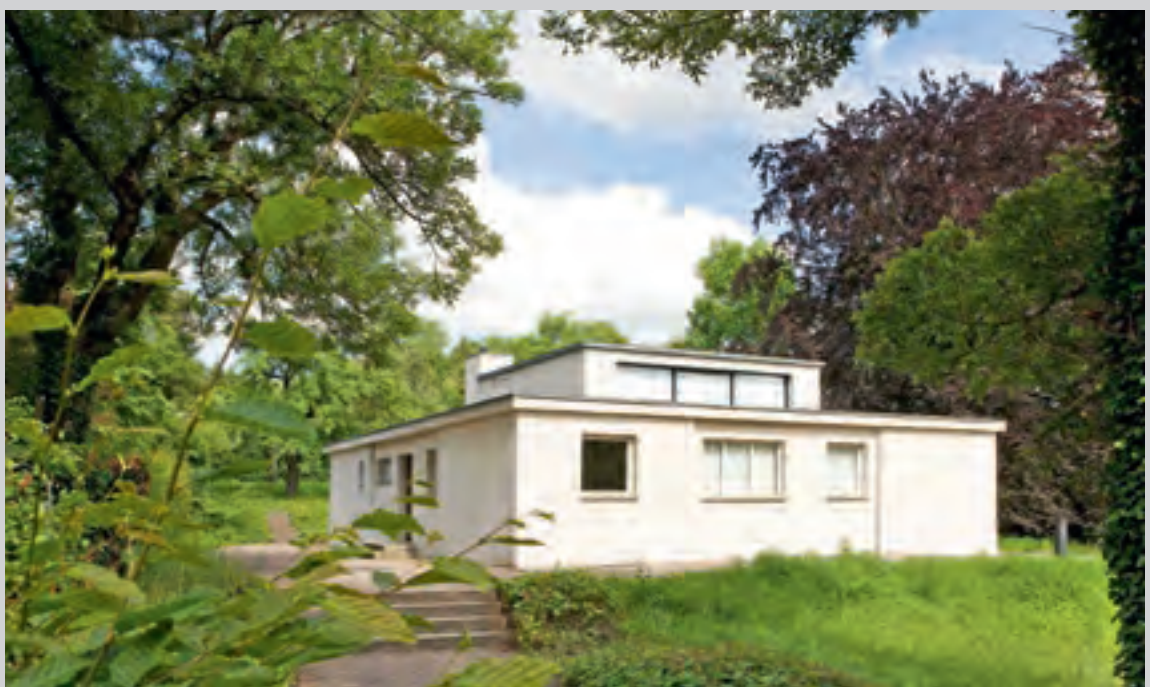
Muches Haus Am Horn – Prototyp des Wohnungsbaus

Fast in Sichtweite zu Goethes Datsche, keine 200 Meter entfernt, hat der am Bauhaus lehrende Georg Muche ein ganz anderes Haus entworfen: schnörkellos, weiß, die Räume um einen zentralen Aufenthalts-