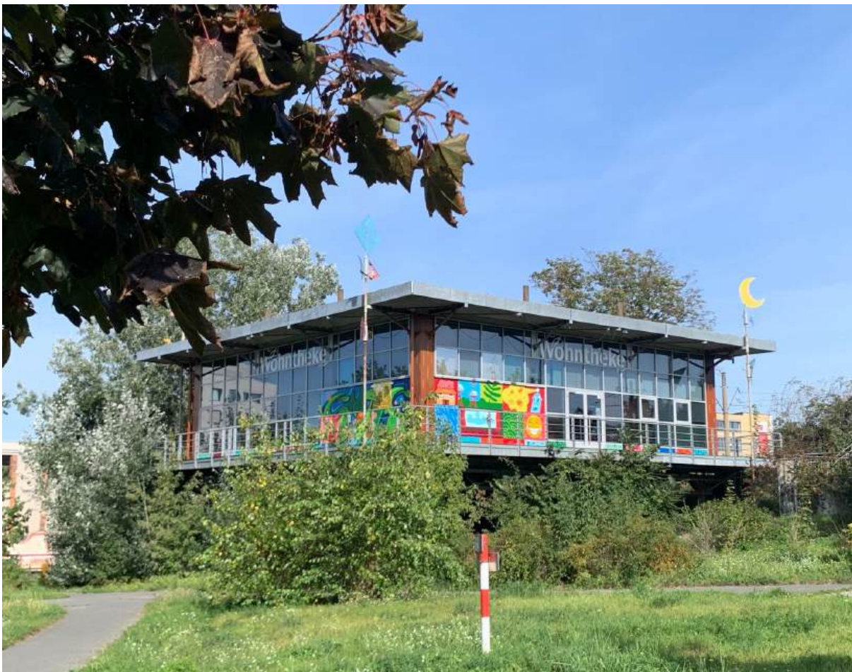
Der „BAUKASTEN“, Sitz des Kompetenzzentrums Großsiedlungen