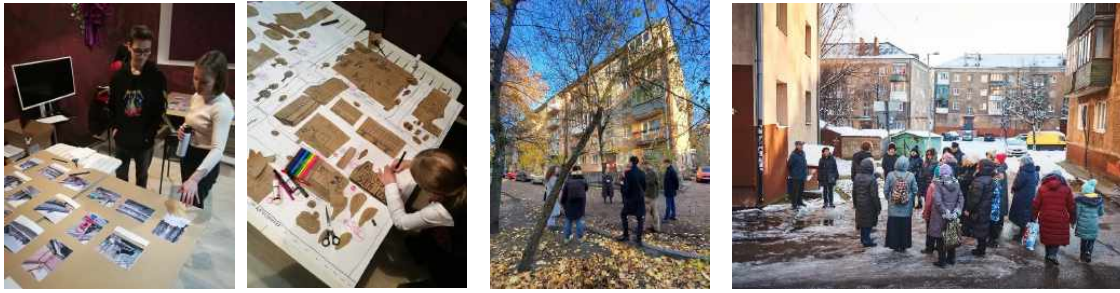
65 lokale Treffen der Aktivisten in den Städten: Samara, Yekaterinburg, Ufa, Kaliningrad, Charkiw