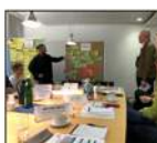
TRIENNALE DER MODERNE / FORSCHUNG