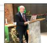
FACHTAGUNGEN / VORTRÄGE