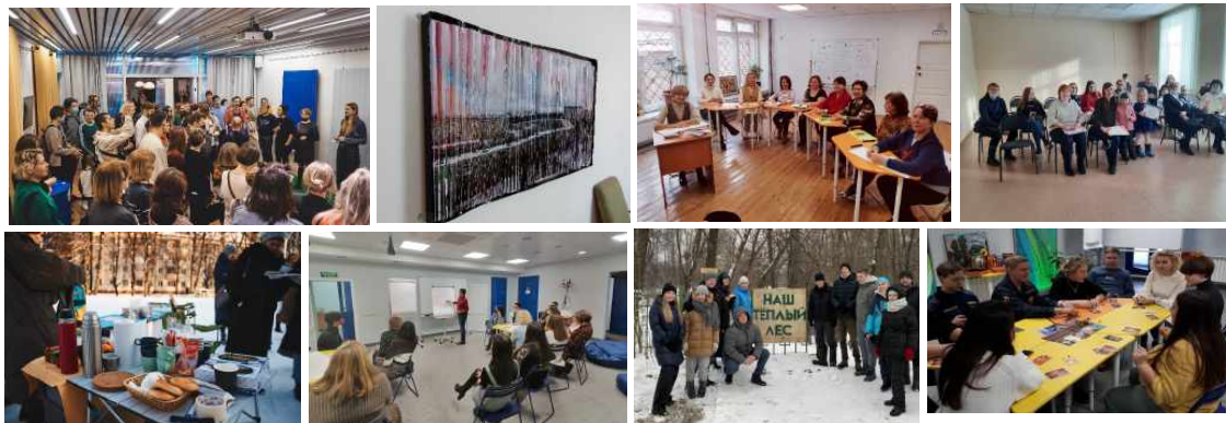
Mitglieder des Kompetenzzentrums unterstützen das Projekt „PRO NACHBARSCHAFTEN“

Kompetenz- zentrum Groß- siedlungen e.V.