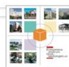
AG SOZIALES Sozialer Zusammenhalt