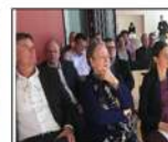
MITGLIEDERVERSAMMLUNG JAHRESVERSAMLUNG VORSTANDSSITZUNG