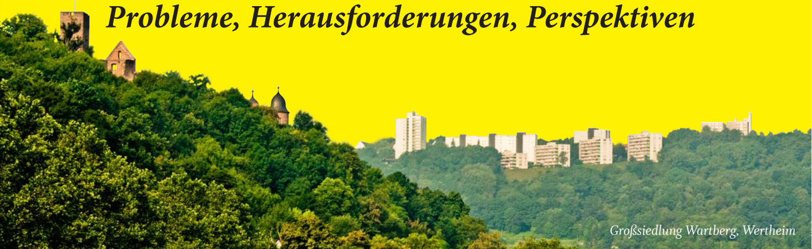
Großsiedlung Wartberg, Wertheim

Vor welchen besonderen städtebaulichen, wohnungs- und sozialpolitischen Herausforderungen stehen Klein- und Mittelstädte mit Großwohnsiedlungen aus den 1960-er und 70-er Jahren? Es werden die Ergebnisse einer Studie des Städtebau-Instituts im Auftrag der Wüstenrot Stiftung vorgestellt. Es wurden acht Siedlungen der insgesamt etwa 120 Großsiedlungen westdeutscher Klein- und Mittelstädte untersucht: Amberg St. Sebastiansviertel, Haar Jagdfeldring, Neu-Isenburg Gravenbruch, Neuwied Raiffeisenring, Nürtingen Roßdorf, Unna Berliner Allee, Wedel Gartenstadt Elbhochufer, Wertheim Wartberg.