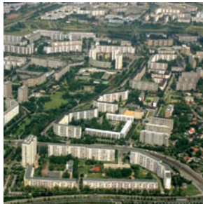
Wohngebiete der 1970er und 1980er Jahre in den neuen Bundesländern Leitbild: „Komplexer Wohnungsbau“ (z. B. Marzahn-Hellersdorf, Berlin)

Große Wohnsiedlungen sind vielfältig – die Handlungsbedarfe für die städtebauliche Weiterentwicklung unterschiedlich! Sie sind ein unverzichtbares Zukunftspotenzial der Stadtentwicklung und Wohnraumversorgung.