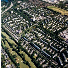
Mehrgeschossige Wohngebiete der 1950er und 1960er Jahre Leitbild: „Aufgelockerte Stadtlandschaft“ (z. B. Neue Vahr, Bremen)